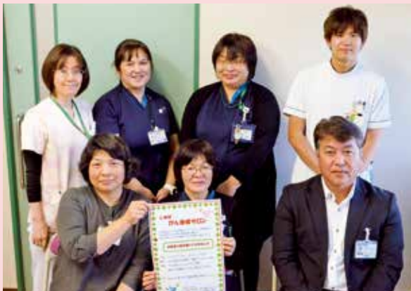
がんサロン運営メンバー

「それぞれの体験を話し合うこと で、悩んでいるのは自分だけで無い ことに気が付いた」等の感想をいた だいています。次回は3月6日 （金）に行う予定です。参加しやす いよう運営スタッフと話し合いを重 ねて開催しています。申込は不要な のでお気軽にご参加ください。詳細 は院内掲示または、当院WEBサイ トをご覧ください。