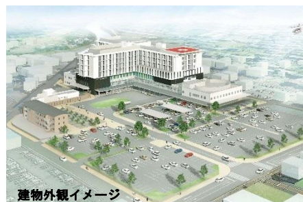
建物外観イメージ